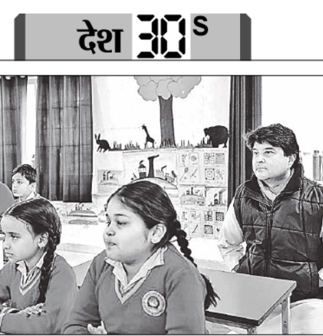
मध्य प्रदेश के अशोक नगर जिले के चंदेरी में एक स्कूल के उद्घाटन के बाद मासूम बच्चों के साथ बैठक केंद्रीय संघार मंत्री ज्योतिरादित्य सिंधिया।