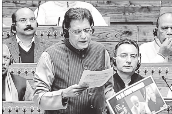
लोकसभा में बुधवार को व्यापार समझौते की जानकारी देते केंद्रीय मंत्री पीयूष गोयल।

नई दिल्ली, विशेष संवाददाता। केंद्रीय वाणिज्य एवं उद्योग मंत्री पीयूष गोयल ने बुधवार को भारत-अमेरिका व्यापार समझौते को लेकर संसद के दोनों सदनों में बयान दिया। गोयल ने कहा कि समझौते में भारत के कृषि और डेयरी जैसे संवेदनशील क्षेत्रों और उनके हितों की सुरक्षा सुनिश्चित की गई है।