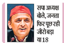
साबित नहीं हो सकती है। कृषि और डेयरी को बचाने का जो झूठ संसद में बोला जा रहा है, उसका संज्ञान भविष्य में लिया जाएगा और झूठा साबित होने पर कार्रवाई की मांग भी की जाएगी।

नई दिल्ली/लखनऊ, वि.सं। समाजवादी पार्टी के राष्ट्रीय अध्यक्ष अखिलेश यादव ने भारत-अमेरिका के बीच हुए व्यापारिक समझौते पर बुधवार को सरकार पर जमकर हमला बोला। सपा नेता ने कहा कि यह डील नहीं, ठील है। भाजपा की उल्टी गणित से जनता फिर पूछ रही है, जौरो बड़ा या 18। इस देश में कोई भी डील जो 70 फीसदी कृषि आधारित जनता के लिए हानिकारक है वो कभी लाभकारी